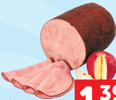
Schirnhofer Jagdherrnschinken 100g statt 2,95