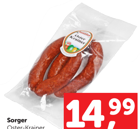
Sorger Oster-Krainer 1kg statt 19,99