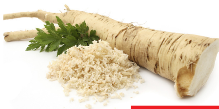
Steirischer Kren 1kg