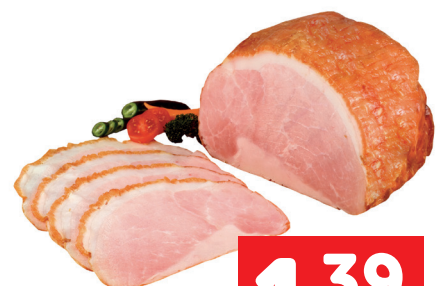
Schirnhofener Krustenschinken 100g statt 3,09