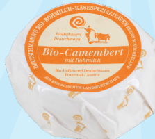
Deutschmann Bio-Camembert 100g statt 3,12