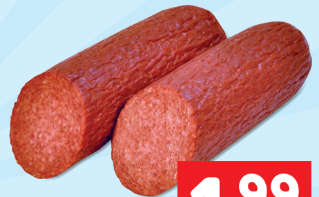
Messner Rosenkogler 100g statt 2,84