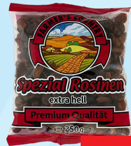
Farmer's Country Spezial Rosinen 250g statt 1,79