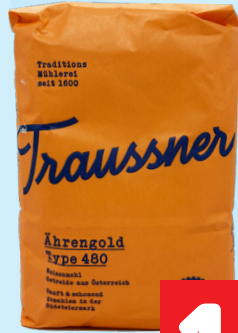
Traussner Mehl, Ährengold 1kg statt 1,59