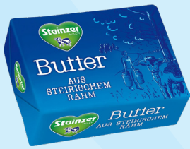
Stainzer Süßrahmbutter, 250g statt 2,99