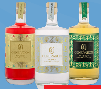
Distillery Krauss Generation Aperitif 700 ml Vodka - 29,99 Whiskey - 49,99