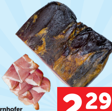
Schirnhofer Schinkenspeck 100g statt 4,49