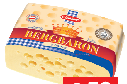
Schärldinger Bergbaron 100g statt 2,19