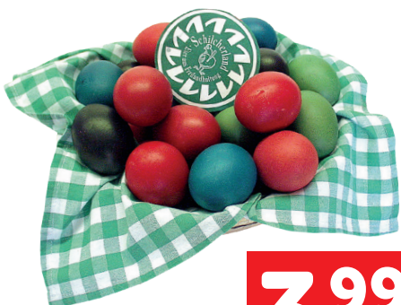
Kumpusch Oster-Eier, gefärbt 6 Stück

OSTERBROT - VORBESTELLUNG! unter 03463 2106-13 oder lebensmittel@hubmann.st