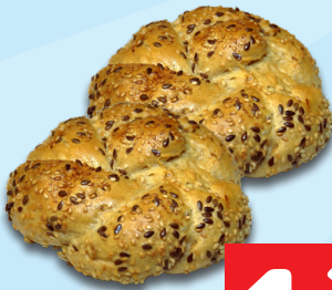
Freydl Dinkelknöpfe 1 Stück statt 1,40